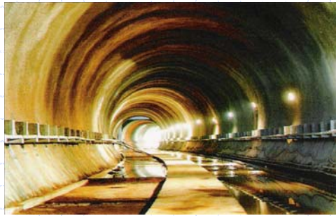
Túnel Via Dupla – Metrô DF

www.institutodeengenharia.org.br 7 de março de 2007