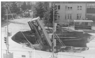
FOTO 01: Tabela 4.4, item nº 38 Colapso de Túnel em Munique, Alemanha – 1994 (ANDERSON, 1997a)