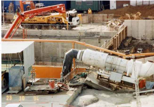
Heathrow – Ruptura do Túnel junto ao Poço de Emboque

www.institutodeengenharia.org.br 7 de março de 2007