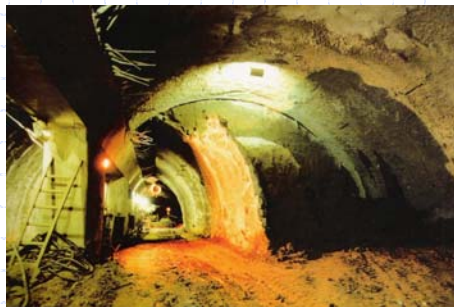
Vista do Interior da Estação durante a escavação

www.institutodeengenharia.org.br 7 de março de 2007