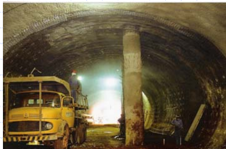
Passagem sob Estrutura com Fundação Profunda – Metrô DF

www.institutodeengenharia.org.br 7 de março de 2007