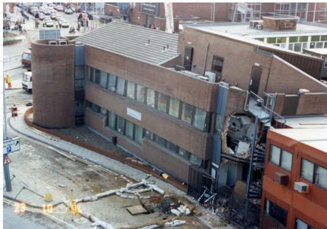
Heathrow – Ruptura do Túnel e Edifícios Sobrejacentes

www.institutodeengenharia.org.br 7 de março de 2007