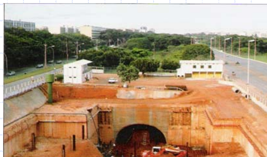
Estação na Asa Sul

www.institutodeengenharia.org.br 7 de março de 2007