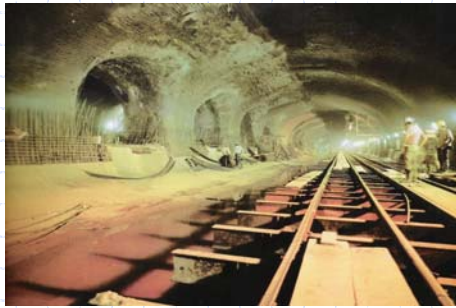
Vista do Interior da Estação durante a escavação

www.institutodeengenharia.org.br 7 de março de 2007