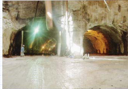
Vista do Interior da Estação

www.institutodeengenharia.org.br 7 de março de 2007