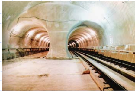
Vista do Interior da Estação no final da construção

www.institutodeengenharia.org.br 7 de março de 2007