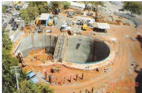
Vista do Poço de Acesso

www.institutodeengenharia.org.br 7 de março de 2007